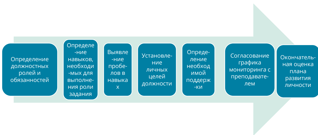
Изображение 3: Процесс создания плана личного развития

На Изображение 3 представлен обзор того, как вы могли бы подойти к предоставлению этого модуля и как этот модуль соотносится с подготовкой персонального плана развития учащегося.