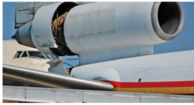
(Ffynhonnell: D. Harper)