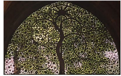
(Ffynhonnell: D. Harper)

Y thema ar gyfer Crefftau Dylunio yw 'Y Dwyrain yn Cwrdd â'r Gorllewin' . Mae'r thema hon yn gallu cael ei defnyddio i ddatblygu syniadau ar draws yr amrywiaeth o arteffactau Crefftau Dylunio. Gallwch edrych ar arteffactau o ddiwylliannau eraill o gwmpas y byd a sut mae'r dylanwadau hyn wedi cael eu defnyddio i greu syniadau newydd a darnau cyfoes. Dylech dalu sylw arbennig i liw, llinell, gwead, golau, graddfa, siâp, addurn arwyneb, silwét, patrwm a sut gallant gael eu haddasu i 'Y Dwyrain yn Cwrdd â'r Gorllewin' .