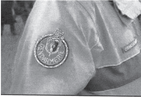
Un uniforme de gendarme

1er décembre 2006 : Isabelle Guion de Méritens est devenue le premier officier de gendarmerie française promu au grade de Colonel, après avoir été, en 1987, le premier officier féminin recruté par la gendarmerie nationale.